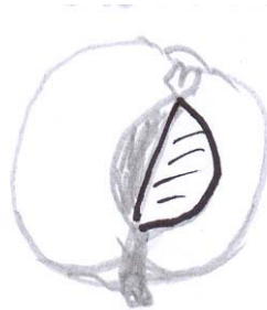
Choisel 2008 selon

OBSERVATIONS: Bois vigoureux. Lenticelles sur rameaux petites, rondes.