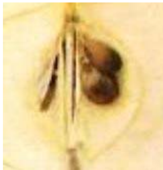
LOGES : Feutrées Oberdieck.

CHAIR: Blanchâtre et colorée de vert (chez Vercier = Blanche, moins probable)(blanc jaunâtre chez Oberdieck). ,tendre, acidulée, peu sucrée(Vercier), peu juteuse(Vercier), juteuse(Brogdale), bonne.